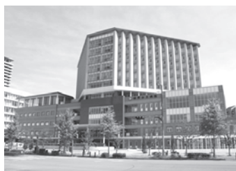
福岡山王病院 福岡県福岡市早良区百道浜 / 病床数: 199床