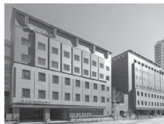
山王病院・山王バースセンター 東京都港区赤坂 / 病床数: 79・19床