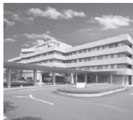
国際医療福祉大学塩谷病院 栃木県矢板市 / 病床数: 240床