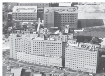
高木病院 福岡県大川市 / 病床数: 506床