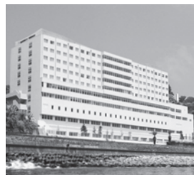
国際医療福祉大学熱海病院 静岡県熱海市 / 病床数: 269床