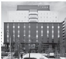
国際医療福祉大学三田病院 東京都港区三田 / 病床数: 291床