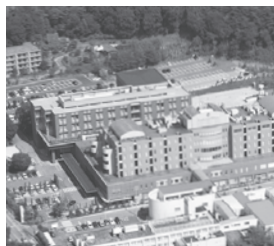
国際医療福祉大学病院 栃木県那須塩原市 / 病床数: 353床