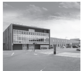
国際医療福祉大学市川病院 千葉県市川市国府台 / 病床数: 260床