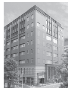
山王メディカルセンター 東京都港区赤坂 / 病床数: 15床

福岡キャンパス 福岡県福岡市早良区百道浜1-7-4 (1号館) TEL0944-89-2000 (九州地区入試事務局) ■福岡看護学部 看護学科