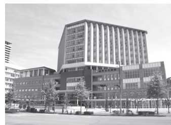
福岡山王病院 福岡県福岡市／病床数: 199床