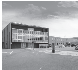
国際医療福祉大学市川病院 千葉県市川市／病床数: 260床