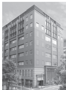
山王メディカルセンター 東京都港区／病床数: 15床