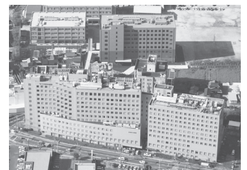
高木病院 福岡県大川市／病床数: 506床

成田キャンパス 千葉県成田市公津の杜4-3 TEL0476-20-7810 (入試事務統括センター)