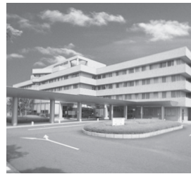
国際医療福祉大学塩谷病院 栃木県矢板市／病床数: 240床