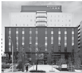
国際医療福祉大学三田病院 東京都港区／病床数: 291床