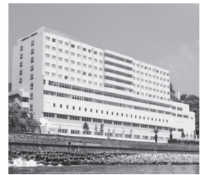
国際医療福祉大学熱海病院 静岡県熱海市／病床数: 269床