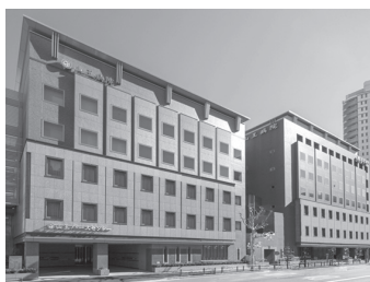
山王病院・山王バースセンター 東京都港区／病床数: 79床・19床