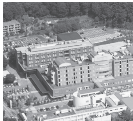
国際医療福祉大学病院 栃木県那須塩原市／病床数: 353床